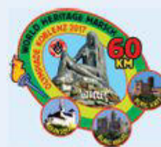
Badge 60 Km-March